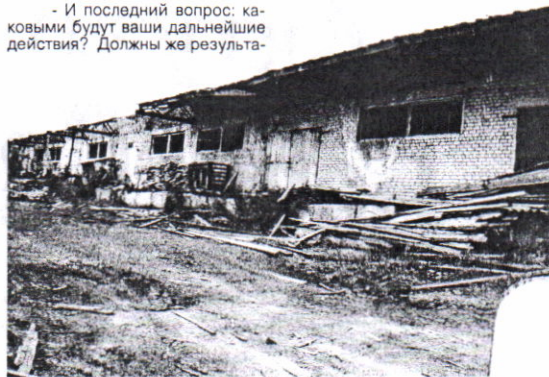
Возле этого здания находится небезопасно.

— Да все без изменений. Только вызывает еще большую озабоченность, так как эти объекты стали представлять собой опасность для населения. Эти объекты могут просто рухнуть и, не дай, Бог, чтобы кто-нибудь оказался поблизости. Такая же картина и на промышленной базе бывшего предприятия «Карабула -98», которое подверглось пожару. В течение года администрация поселка, депутаты писали представления в различные инстанции, в том числе в администрацию района, о необходимости принятия срочных мер