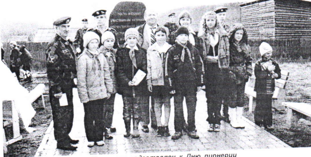
Материал подготовлен к Дню пионерии

Делимся позитивным опытом работы с детьми и молодежью на страницах школьной газеты "Максимум", районной газеты "Ангарская правда", выпускаем буклеты на общерайонные конференции.