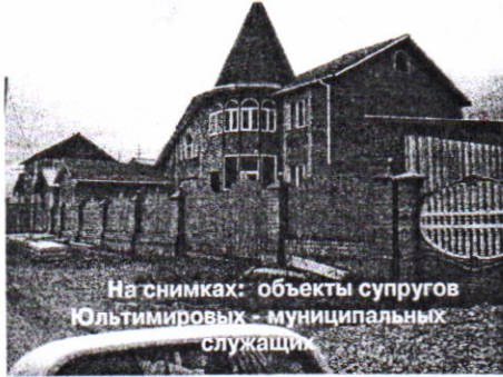
На снимках: объекты супругов Юльtimiрировых - муниципальных служащих